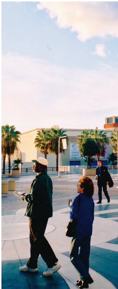
Konferensdeltagare på väg.